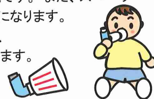
スパーサーの替わりに紙コップが使えます